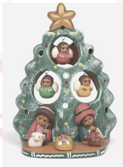
UN DESEO DE NAVIDAD... CONVERSANDO ENTRE NIÑ@S