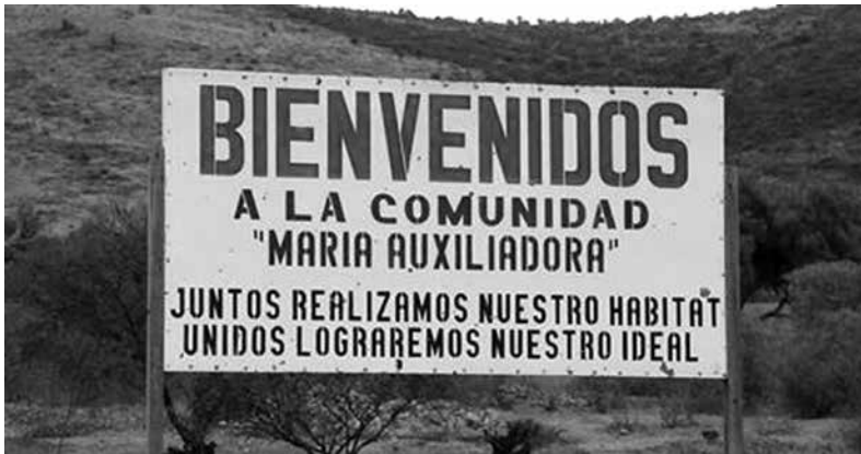
El primer letrero de la comunidad

Con la propiedad colectiva, nace un sentimiento de amor propio... “es nuestro pedazo de tierra”. “Como sabemos que es colectivo y que vamos a vivir aquí para siempre, es lo que tenemos y nos anima a trabajar colectivamente. Somos de diferentes lugares, pero aquí hemos encontrado algo