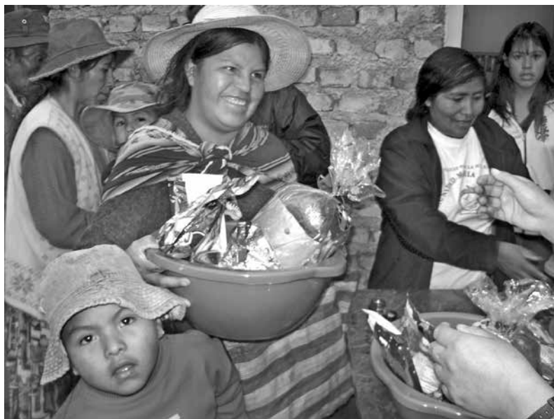
Madre de familia recibe su canastón navideño el 2009

El procedimiento para entrar en la comunidad se ha transformado. Si comparamos con los que entraron en la primera etapa, ahora los pasos son más claros y exigentes, entre otros con la firma de un acuerdo frente a un notario. “Eso es el resultado de los problemas que han aparecido.” Así cada uno pasa por la comprensión y la aceptación formal y legal de los estatutos.