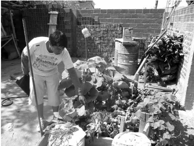
Muchas familias emprendieron su propio huerto