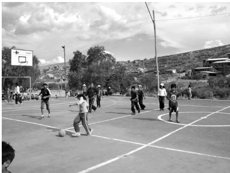
Cancha deportiva en el sector norte de la comunidad

“Este sentimiento de identidad nos falta reforzar con algo de la cultura. Nos