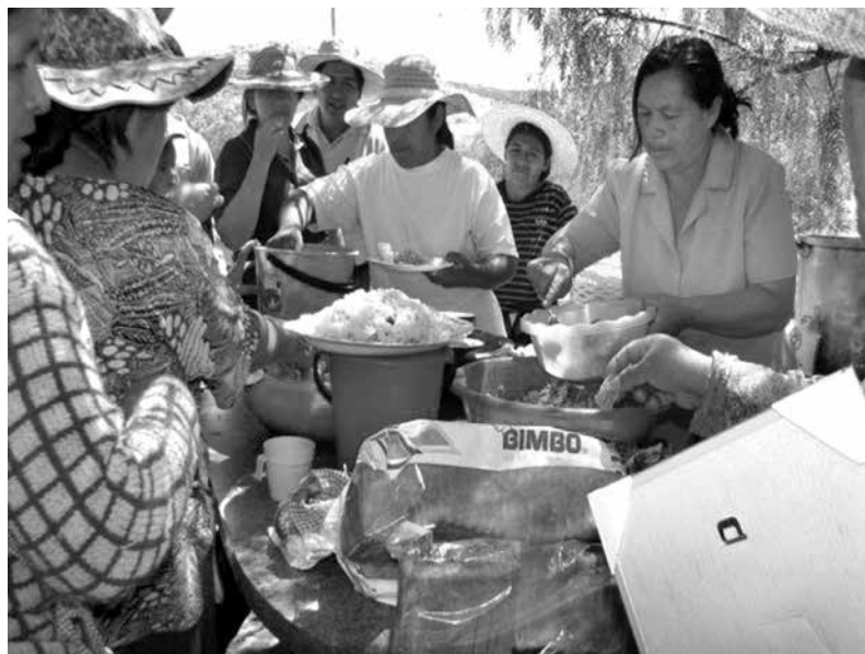
El tradicional aptapi: las familias traen distintos alimentos para compartir