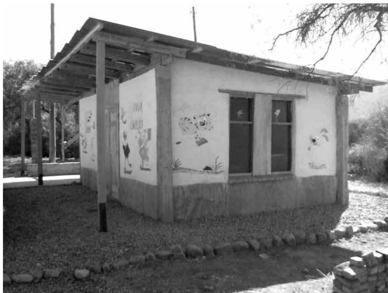
Biblioteca y centro juvenil de la comunidad

Por otro lado, tenemos que luchar por la equidad de género afuera de la comunidad, cuando son las mujeres de la comunidad que van a la sub-alcaldía o al municipio y que no las tratan como a líderes! “No se ha avanzado gran cosa en las cuestiones de género, sino en el discurso! En los espacios públicos, un poco, pero no en los espacios de decisión.”