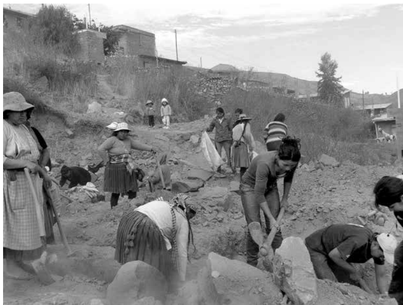
Familias trabajando en ayni para la construcción de una vivienda.

“Vivía hace 15 años en villa México, pero nunca había conocido a nadie como aquí, para mí es otra forma de vivir, conozco a la gente.”