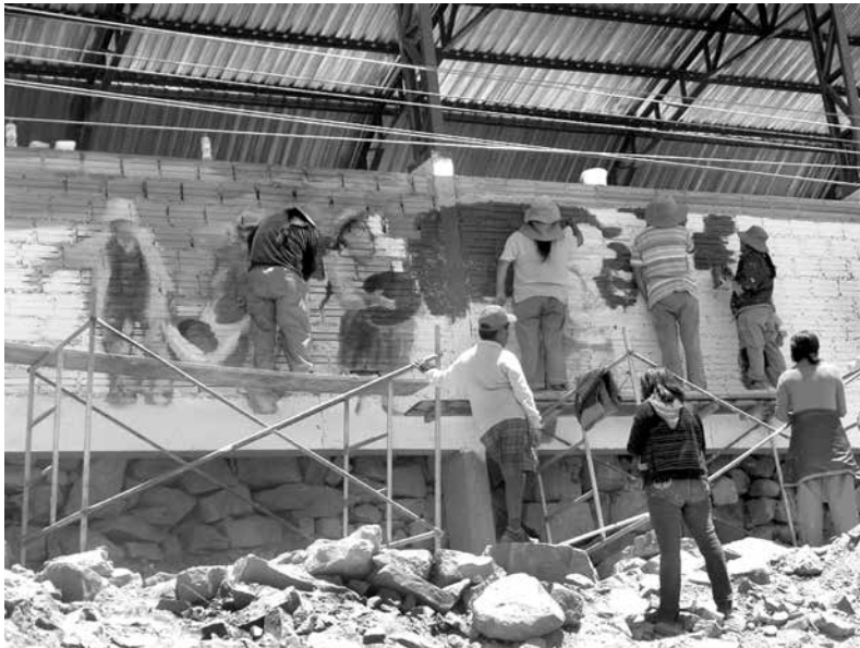
Mujeras constructoras y miembros de la comunidad pintando un mural del Centro Comunitario

“La propuesta desde el inicio era para los papás y para los hijos jóvenes. Pero tuvimos que replantear eso después de unos problemas.” Una madre vino a vivir con sus hijos y su nueva pareja. Una de sus hijas, muy entusiasmada, quería también su terreno, ya que era posible en la época. Entonces, su madre y su padrastro quisieron venderle el terreno. No se lo aceptó y lo que se hizo, fue devolverlo a la hija. Y así empezó la molestia de la madre.