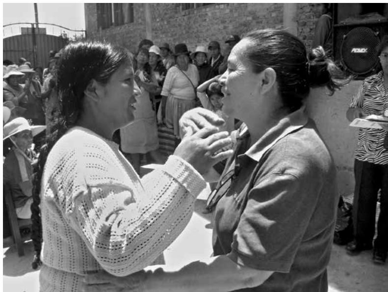
Entrega de certificados de uno de los programas de alfabetización emprendido por maestras de la misma comunidad

“Hemos visto la transformación de muchas familias, no solamente de las mujeres. Había drogas, hoy son jóvenes tranquilos. Las mujeres no se dejan como antes, no son golpeadas como antes y saben que pueden ir al comité de apoyo. La mayoría de los niños estudian.”