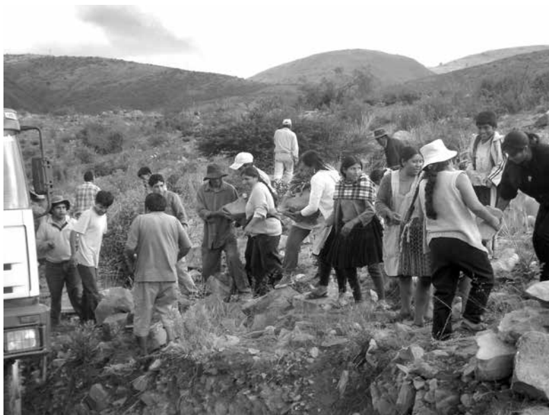
Trabajo comunitario, juntando piedras y rocas para construir el puente de ingreso a la comunidad

Pero ya en 1996, las mujeres líderes de los diversos distritos fueron invitadas a un encuentro internacional de la Red Mujer y Hábitat en Cochabamba.