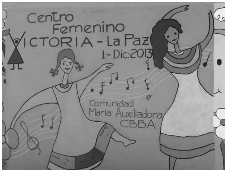
Mural pintado por mujeres constructoras de El Alto de La Paz en el Centro Comunitario

Hay restricciones al consumo de bebidas alcohólicas en la comunidad, no se puede alquilar la vivienda, no hay partición ni división de bienes, para que los hijos se queden a vivir en su casa... las reglas, que han sido pensadas desde el inicio de la comunidad, son parte integrante de la propuesta de María Auxiliadora.