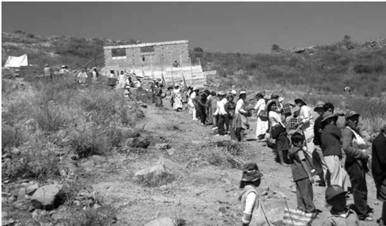
Cadena de trabajo para transportar material de construcción de las viviendas

“Yo me vine a vivir en carpa. Aquí no hay delincuencia, eso es lo que me gustó de la comunidad, y también los trabajos comunitarios.” Hay reglas definidas: por ejemplo, no se puede vender bebidas alcohólicas, no puede haber