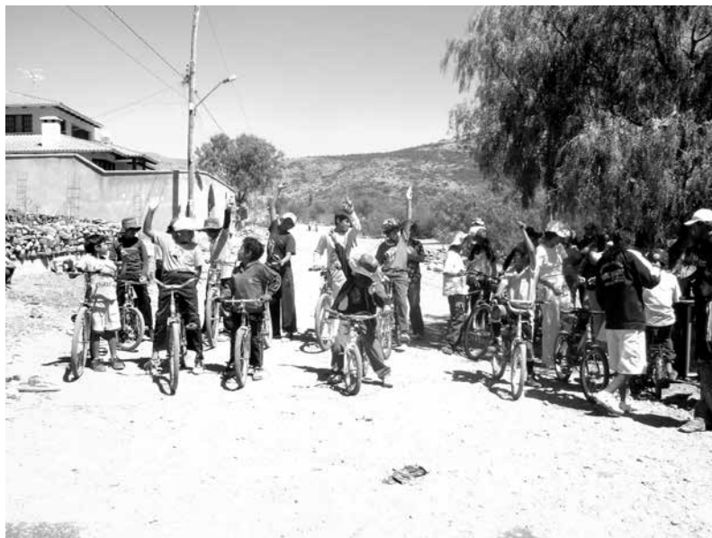
Padres e hijos participando de actividades familiares en conmemoración del 10° aniversario de la comunidad

La propuesta de María Auxiliadora es para todas las personas que no tienen casa. La finalidad es de mejorar la vida de todos, y “se ha pensado