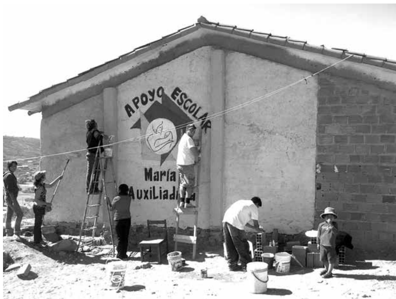
Padres y madres de familia haciendo mejoras y pintando distintivos para el Apoyo Escolar

Muchas entidades nos han acompañado y siguen sosteniendo a la comunidad, vamos a mencionar a algunas sin dejar de agradecer a todas las que se comprometieron y trabajaron con nosotras.